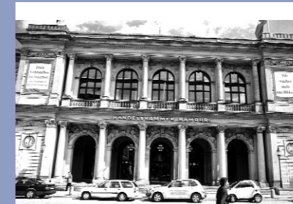
› Handelskammer: Hier geht's zur Steuertagung